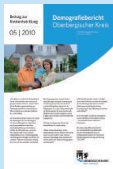
Beitrag zur Kreisentwicklung Ausgabe 5/2010 Demografiebericht Oberbergischer Kreis