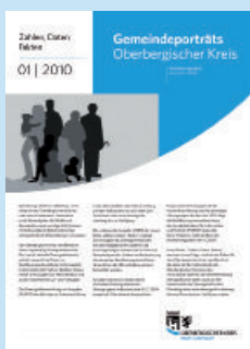
Zahlen, Daten, Fakten Ausgabe 1/2010 Gemeindeporträts Oberbergischer Kreis