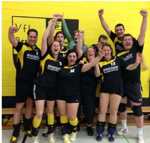
Seit 15 Jahren in Verbands- bzw. Oberliga