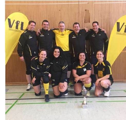
5x Kreispokalsieger in den letzten 7 Jahren