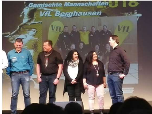
Mannschaft des Jahres 2018 Oberberg